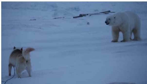
Nanuk svinger med svansen til ære for fotografen.

ganger. Plasseringen gjør at han også kommer med på veldig mange bilder som tas av bamsene. Og da helst med rumpa til fotografen. Så utifra det trekker Hopen Times den konklusjon at Nanuk har verdens mest fotograferte hunderumpe.