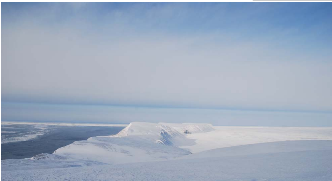
Hopen sett fra Iversenfjellet, Hopens sørligste og høyeste punkt.

Fastis er sammenhengende havis som dannes og blir liggende fastfrosset til land, havbunnen og andre faste punkter. Dannes enten ved lokal tilfrysning eller ved at dravis fryser fast. Fastisen kan være fra noen meter til mange hundre km. bred. På Hopen antagelig sjelden mer enn noen hundre meter pga sterke strømmer.