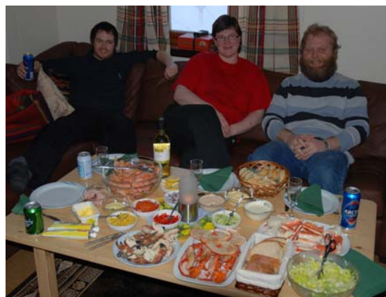
En helt vanlig lørdagskveld på Hopen