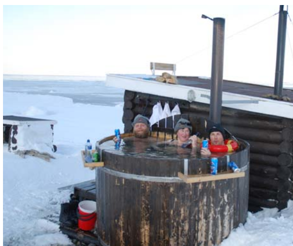
Kroppslig rundvask må til