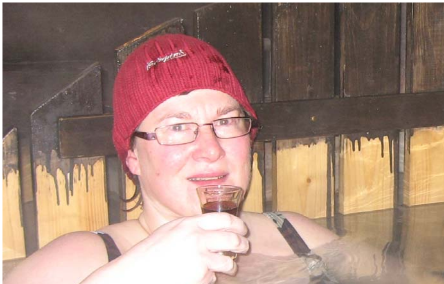
Når kulda blir for streng. Den erfarne ishavskokka har ett og annet triks å lære bort til forfrosne søringer. Her viser hun hvordan holde varmen når kulda røsker i lilletåa.