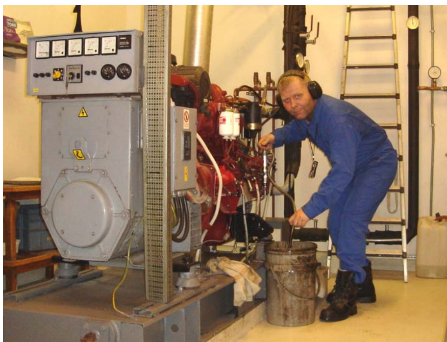
Tyven tatt på fersk gjerning: Bildet er av den mistenkte mens han taper olje fra aggregat nummer 1. Fotograf Eirik Sandberg tok bildet i det hun tilfeldigvis gikk forbi. Den mistenkte er ennå ikke identifisert idet avisen går i trykken

Det undersøkes nå om de to episodene har en sammenheng.