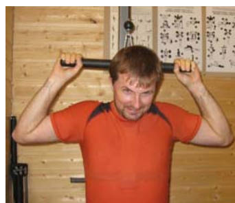
... og løfte tungt