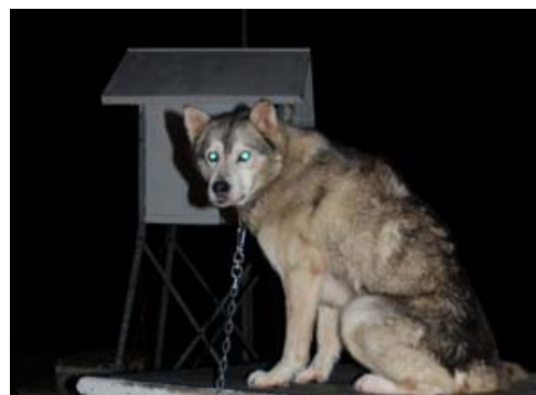
Grumant vokter metbua.