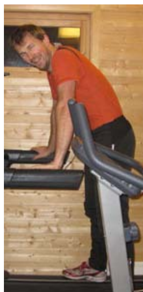
... men morsomt er det og