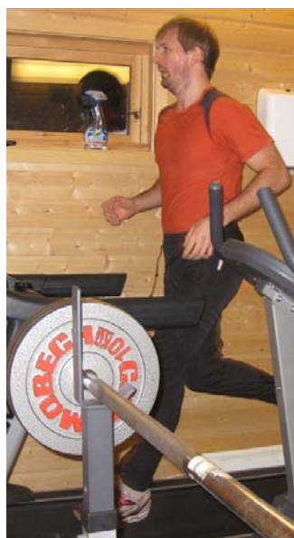
Må løpe fryktelig fort

Ingen må tro at livet på Hopen er lett. Det er et blodslit. Løfte tungt, løpe fortere enn en bjørn, holde ut. Hjertet hamrer og pulsen stiger. Og paparatzifotografen skjønner at dette må verden få del i. En dag uti januar, mens lett yr drysset ned fra himmelen, og vi lurer på hvem som tar feil, vi eller himmelen. Er vi på 76 gr. N, eller langt sør for polarsirkelen.? Hadde det ikke vært for lyset, eller mangel på sådant og de to hvite bjørnene som åpenbarte seg i går, ville tvilen ha vært berettiget. Dessuten, vann omformes til is under visse forhold. Og akkurat slike forhold har vi på Hopen nå. Bare det å bevege seg fra stasjonsbygningen over til verkstedet med dets rike innhold, krever forberedelser – men det er verdt det. Se bare på bildene under!