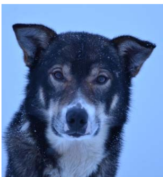
Gisle kan posere.