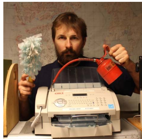
Bestyrer Solhjell sørger for daglig service på telefaks maskinen. «Så virker i hvert fall den når Internett kolliderer.»

Beslutningen om en eventuell frakobling vil bli tatt i løpet av våren.