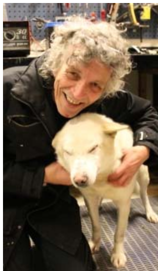
Fra venstre: Ted og Bølge koser seg i verksted.

Bølge er hvit som snø. Alaskan Husky som Gilsen. Bølge har potensial. Bølge er framtiden. Tror vi. Han viser i hvert fall stort pågangsmot, er som en propell på speed når man kommer for å hilse på, for så å bli helt slapp og rolig når man begynner å kose med ham. Trives aller best i fanget. Trekker som en helt og har klart det kunststykket å bli venn med Tyson. Eller venn og venn, Tyson tolerer ham. Nå gjenstår det bare å se hvordan han reagerer på bjørn.