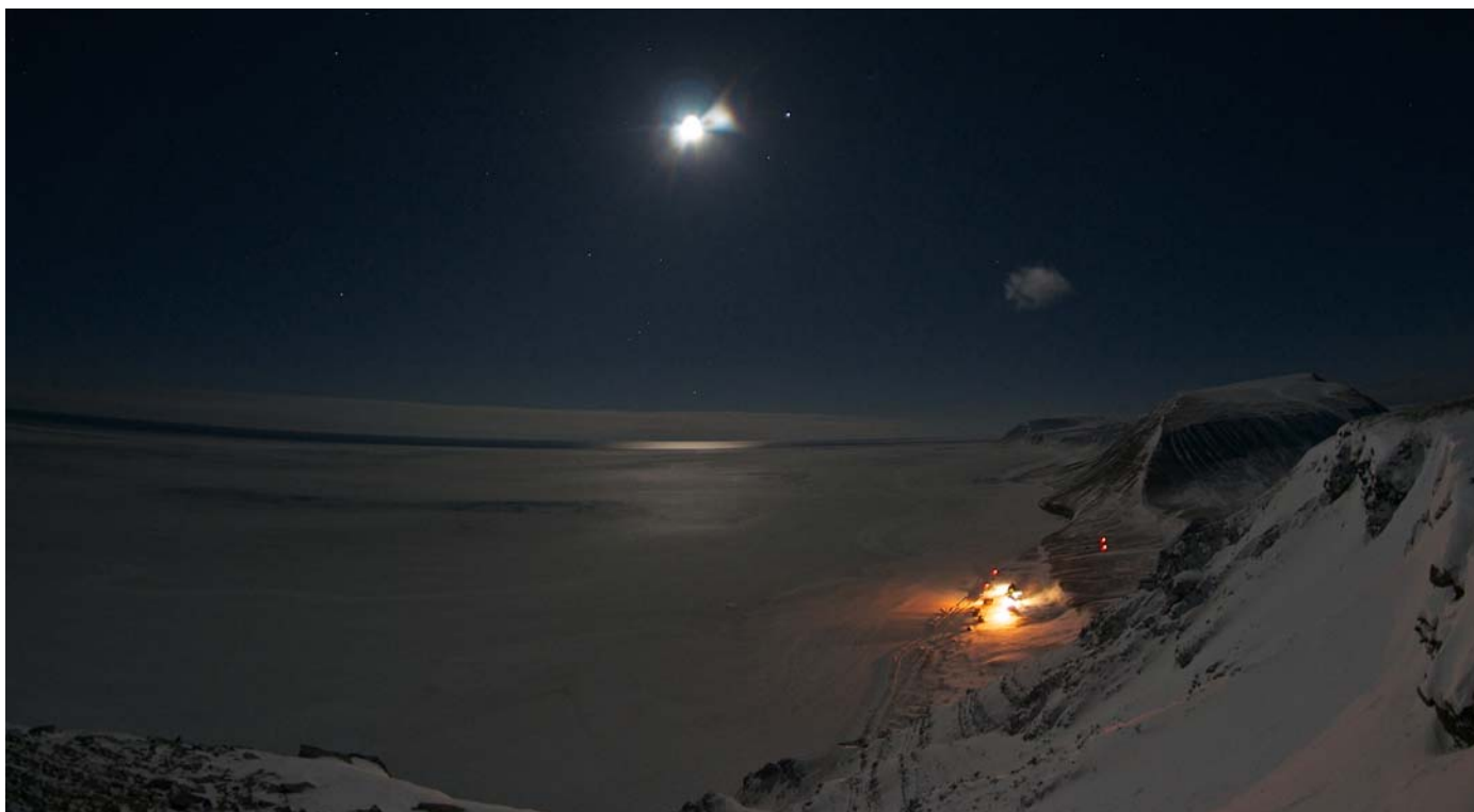
Fullmåne over Hopen. Bjørnøya kan ikke skimtes i sør.

Bortsett fra den lille blunderen med å føre opp Bjørnøya som en fjern øy, så er boken et nydelig stykke arbeid. Den er vakkert illustrert med flotte kart. Sammen med godt skrevne tekster med underfundige opplysninger om øyenes historie, flora og fauna, vil boka appellere til eventyreren i de fleste.