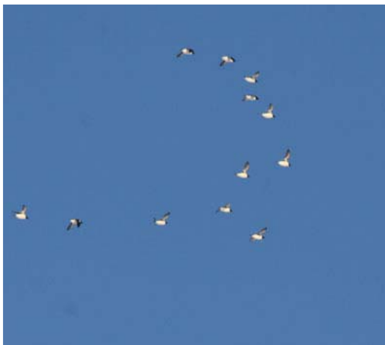
Polarlomvi: Flere enn 100 000 fugl hekker på Hopen. De fleste ankommer i mars og april. Polarlomvi er den mest tallrike arten. Andre arter er, krykkje, havhest, snøspurv, polarmåke med fler.

Leserbrev: Nå må det bli slutt på denne utdige bruken av sommertid. Den ødelegger for en viktig ishavstradisjon. Vinterstid sendes synop kl 15:45 mens sommertid må den sendes kl 16:45. Det vil si midt i TV2's reprise på "Venner for livet", en høyt skattet serie blant ishavsveteraner. Det henstilles de rette myndigheter å fjerne sommertiden, eventuelt å bare endre tiden med en halv time. Muggen polarboms