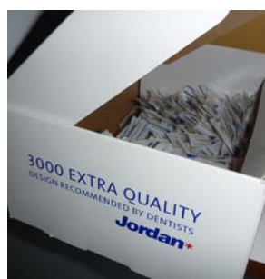
Åpnet i 2003. Vil den overleve et tiårs jubileum?

1 stk. plakate med 2 stk. lett kledde damer har forsvunnet fra den ene veggen i verkstedet. Plakaten har brakt mye glede opp igjennom årene og er sterkt savnet. Den var nært ved å bli registrert som kulturminne. Nå er det bare en lys firkant igjen på veggen. Sist sett i 2006.