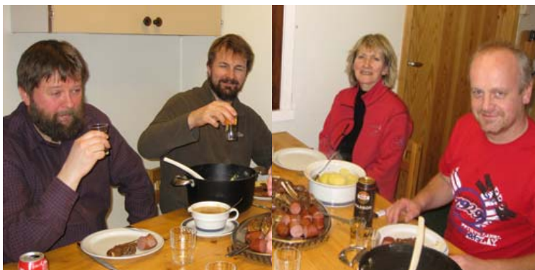
Stasjonsbesetningen koser seg med maten og gleder seg over lysere tider. Bildet under er tatt dagen etter og viser utsikten sørvover fra stasjonen

1 stk skrivesperre funnet sørøst av Negerpynten. Eier bees innstendig om å hente sperren umiddelbart. Hentes i redaksjonen til Hopen Times.