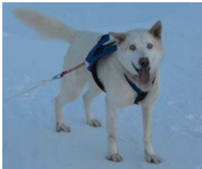
Kan dette ansiktet skremme isbjørn? Eller for den saks skyld, noen som helst?

Ett av de store spenningsmomentene denne vinteren har vært hvordan de to nye hundene, Bølge og Gisle, forholder seg til isbjørn. Absolutt tysnad, er nok svaret på det. Gisle holder seg inne i huset sitt ved første isbjørnbjeff fra Tyson, mens Bølge varsler isbjørn ved å løpe i sirkler, lydløst må vite. Men det er et skår i sorgen, begge hundene kan jage isbjørn. Særlig Gisle har vist talent for isbjørnjaging når han slippes løs. Et morsomt utslag her, er at Gisle som beskrevet i forrige nummer av avisa, ikke er så glad i snøfonner og løssnø. Så midt i ivrig isbjørnjaging, kan han finne på å stoppe opp fordi han synes underlaget er ubehagelig. Et av verdens største og farligste rovdyr kan altså angripes, så sant snøen er behagelig å gå på.