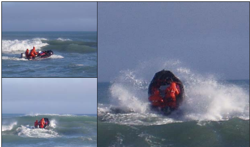
Bølgerafting: Velferden ved Hopen Meteo. prøver ut det nye velferdstilbudet til besetningen.

Longyearbyen neste. På Halvmåneøya skulle de treffe den andre båten i turlaget for så å sette kursen for Longyearbyen. Dønningene etter avslutningsfesten har allerede nådd Hopen.