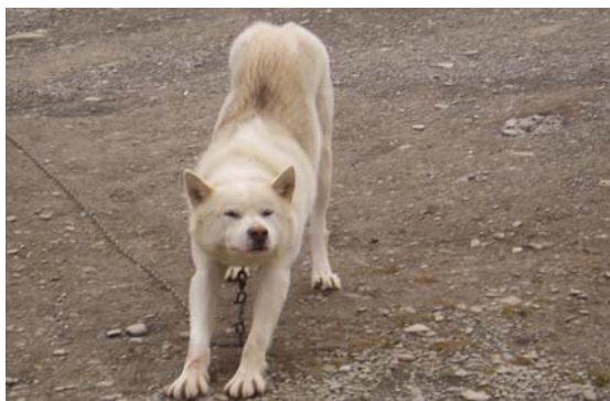
Mett. En godt fornøyd Nanuk strekker ut etter et lettere mellommåltid.