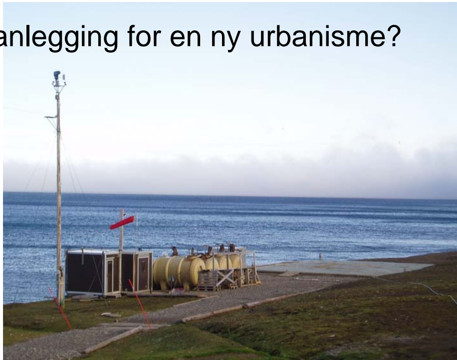
Arkitektens Heliport: Utviklingen av Heliporten blir dominert av endeløse debatter mellom arkitekter om planløsninger og siktlinjer (-ikke minst siktlinjer!) Ingen diskuterer problemet i at et bestemt arkitektsyn får dominere planløsningene og områdesonderingen, skriver Alfred Koller. Hopen Heliport, august 2004.

Politikere vil tilføye at stasjonsplanlegging handler om boligpolitikk, levekår, kultur og demokrati. Planleggere ansatt hos Sysselmannen vil kanskje si at det dreier seg om de svakes interesser, helhet, stedsidentitet og stedstilhørighet. Ingen snakker om for eksempel den romlige disiplineringen av hverdagslivet, individualiteten, samhörigheten og forutsigeligheten. I hvert fall ikke høyt.