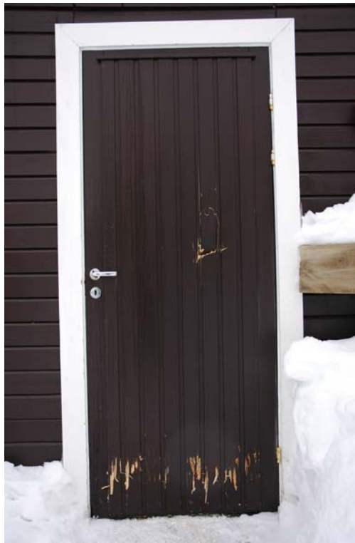
Ødelagt. Kanskje siste vinter for denne døra.