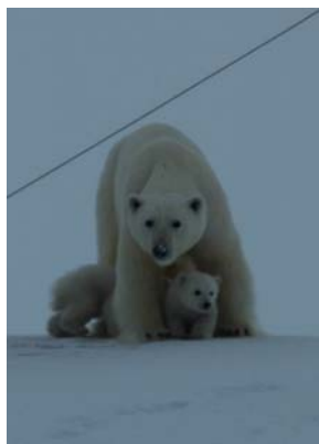
Besøk. Mor og barn på tur.