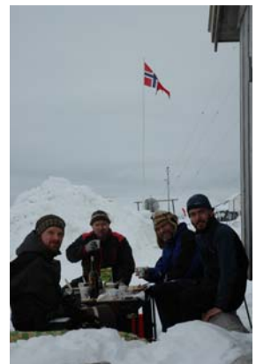
Trivelig. God stemning ved grillen på Hopen.

Grillparty. 8. mai blei grillen på Hopen fyra opp for første gong dette året. Alle venta på ein rørende tale frå stasjonssjefen i anledning frigjeringsdagen. Men det vart verken tale om frigjeringa eller gode valkampsaker. Likevel håpar Hopen Times på ein hektisk og intens valgkamp på Hopen utover sommaren, der det blir argumentert hardt både for Blå og Rød/Grøn regjering.