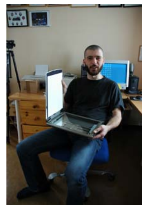
CanonScan. Ein stolt redaktør med nyvinninga.

No gjeld det berre å nytte skanneren på ein god å rasjonell måte, og frå og med dette nr. vil Gamle Hopen bli eit fast innslag. Der vil me leite på veggjar, i skuffer og i skap etter gode blinkskudd frå gamal tid her på Hopen, skanne dei og presentere dei for vore lesarar.