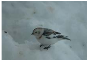
Snøspurv. Årets vårteikn.

Idol. Ei uoffisiell undersøking blant besetninga på Hopen syner at Jorun Stiansen er den deltakaren dei har mest tru på i årets Idol konkurranse.