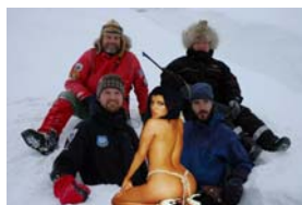
Toppløs. Årets mannskapsbilette blei litt ekstra kryddra. Godt ingen gjekk i hiet.