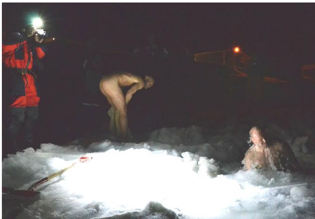
Julebesøket tester ut sørpa på Hopen. Noe særlig mer is enn dette har det ikke vært denne vinteren.

Denne aktuelle datoen var Sysselman og prest på sitt årlige julebesøk ved Hopen Meteorologiske stasjon for å spre litt juleglede blant besetningen der.