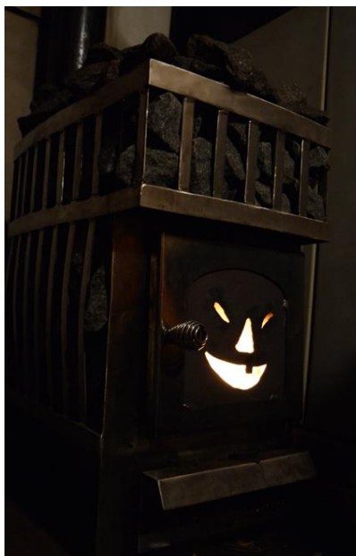
Den nye badstuovnen håper på å få en rolle i "Lokomotivet Thomas og vennene hans".

Den største forbedringen består i en ny badstuovn. Denne er tegnet og konstruert på Hopen. Foreløpige tester viser at den er langt bedre enn de tidligere kjøpevariantene. Det mest geniale som er gjort er å lage et stort magasin for stein. Dette gjør at man får et større varmelager og større overflate for fordampning av vann. Alt i alt en god ovn for å lage perfekte driftsforhold i badstua.